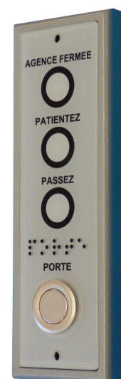
Exemple de produits associés.