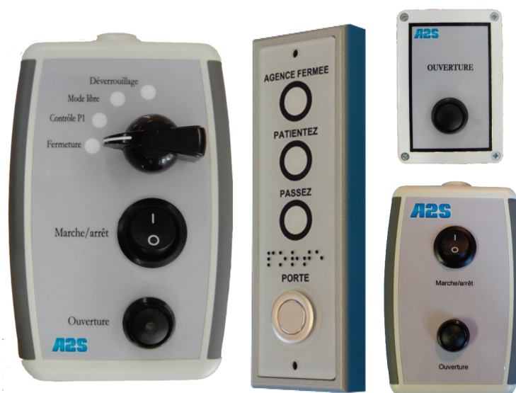
Exemple de produits associés.